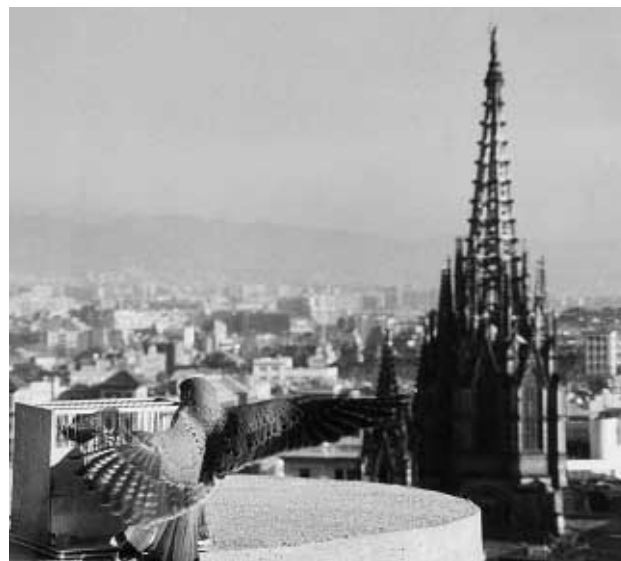
Una cernicalo común macho ataca un cebo colocado en una jaula en la azotea de la iglesia del Pi